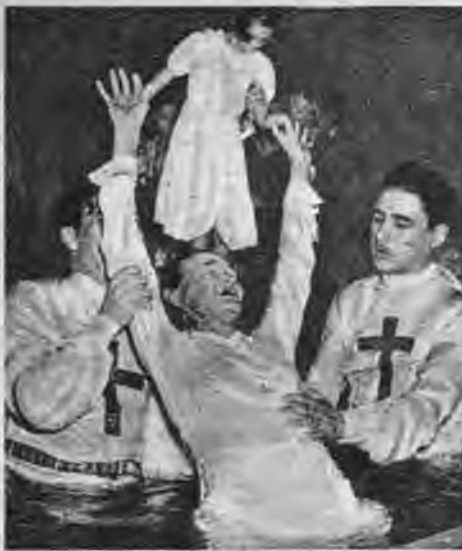
Ekstazē, kas līdzinās ārpriekšam, „jaunatgriezta ticības māsa” saņem kristību no sekas vadītāja. Lai to saņemtu, viņai jābrien līdz kaklam dubļos.

Formas, kādas šī īpatnējā tirdzniecība Amerikā guvusi, jau līdzinās ārpriekšam un jādomā, ka taisnība būs tam, kas Ameriku nosaucis par pasaules trakonamu. Gadu desmitus un simtus skriedami pakal tikai naudai, amerikāņi aizmirsuši arī tās kultūras paliekas, ko viņu senči — ieceļotāji no Eiropas — bija atveduši līdz. Kad trakais skrējieni pēc naudas bija mazliet apstājies, kad veiklākie un nekaunīgākie bija sarāvuši miljonus, kamēr neveiksmīgākie joprojām skrandās tērpti ubagoja gar bagāto durvīm, notika mazs lūzums amerikāņu uzskatos. Jaunbagātņieki, nezinādami kur likt savus dolarus, vērsa skatu uz veco Eiropu un ieraudzīja, ka Eiropā gan nav tik daudz dolaru, bet ir citas vērtības — kultūra. Parādūši visu pīrk par naudu, amerikāņi arī kultūru mēģināja vienkārši nopīrk. Kad tas neizdevās, radās uzņēmīgi ļaudis, kas sāka kultūru ražot pašu mājās. Pēc Eiropas parauga pie kultūras lietām piederēja arī reliģija. Arī to vienkārši nokopēja. Bet tā kā Eiropas reliģiju baznīcas palika pustukšas,