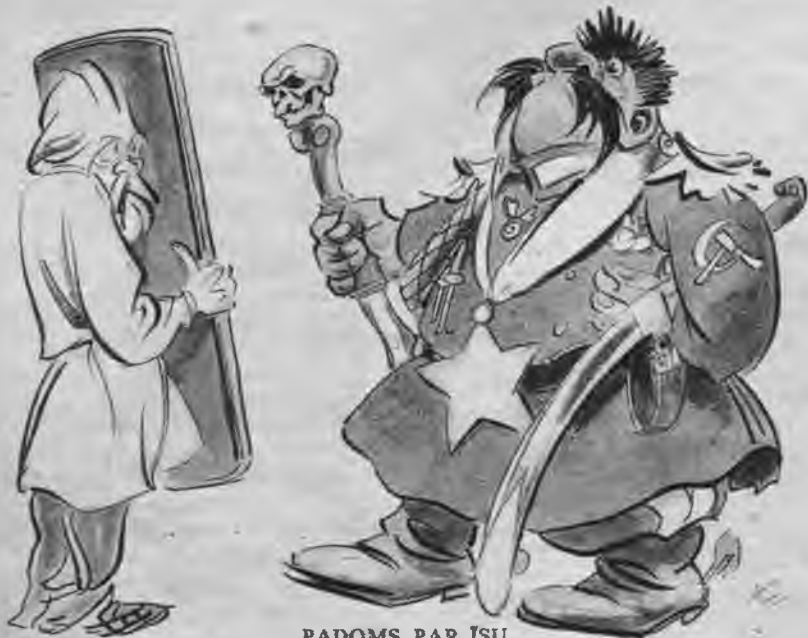
PADOMS PAR ISU.

Brāļi! Vazēlīgi pieņēmis padomju maršala titulu