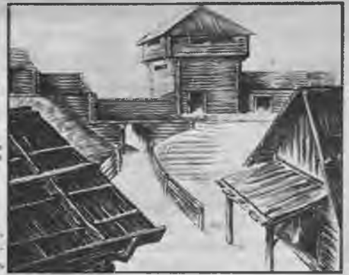
Senās Mežotnes pils vārtu vietas iekšpuses skata rekonstruktijs zīmējums. Zīm. P. Pauļuks.

Lielupe — zemgaļu upe šķērso Zemgales seno novadu Ūpmali. Šā novada senvietu starpā izdalās divi senatnē ievērojami novada centri. Viens ir tagadējā Bauska ar pilskalnu, uz kuŗa vēlāk celta ordeņa pils un atradās plašie senkapu lauki pilsētas apkārtnē. Otrs centrs bija senā Mežotne ar diviem pilskalniem — t. s. Viestura kalnu un Vīna kalnu — senās pilsētas vietu starp minētajiem kalniem un plašu kapu lauku.