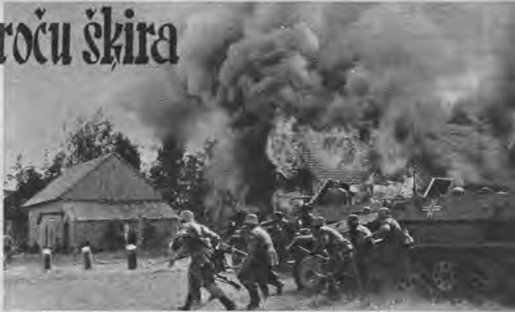
Grenadieris tanku uz sardzībā pienākuši pa visam tuvu ienaidniekam. Drosmīgā uzbrukumā ieņem ciemu

Aizvien no jauna Vadoņa savās runās piemin šo biedriskumu, ko tas pats pieredzējis pirmajā pasaules karā kā vienkāršs kājnieks, bez slavena vārda. No šīs pieredzes izaugusi Vadoņa nesatricināmā ticība un drošme — ar karavīru kopību, ko cieši vieno biedriskuma saites — doties pret ienaidnieku pulku un uzvarēt.