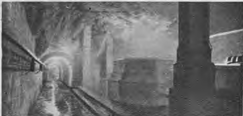
Reichenhalles apakšzemes sāls avoti, kuru izmanto dziedniecības nolūkiem.

sāls muitas iekasēšanas tiesībām lika apstiprināt pašam karalim — Kārlim Lielajam. Ar Zalcburgu tai laikā sāls iegūšanā un tirdzniecībā stipri sacentās otra bīskapu pilsēta Reichenhalle, kas izplatīja sāls tirdzniecību tālu jo tālu pa Romu un uz Šveici, iegūstot tādā ceļā lielas bagātības.