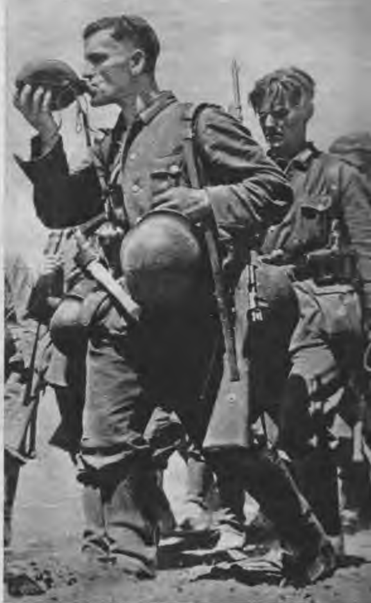
Nedz svelme, nedz slāpes nekavē pelēko kolonnu pārgājienus. Kājnieki nemitīgi soļo pretim jaunām cīņām un jaunām uzvarām, zinādami tikai vienu mērķi: Uz priekšu!