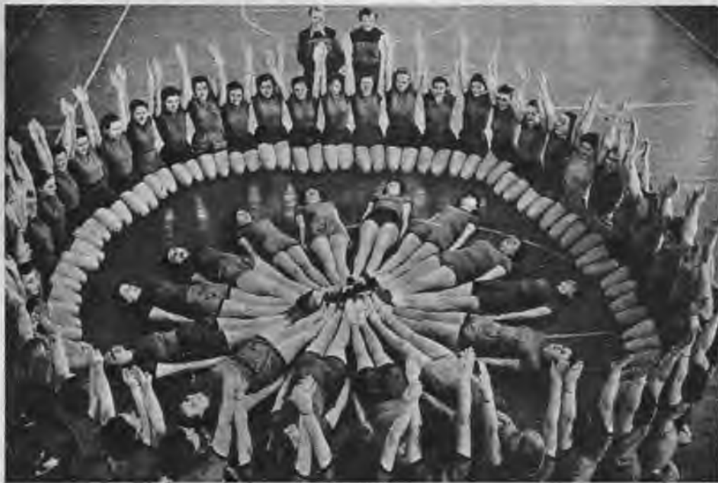
Augšā pa labi: Tā ir tikai daļa no daudzajām gadu ilgušu ko „Universitātes sporta” izcīnījis savos 15 pastāvēšana gados.

Un ja šodien jūs kādam latvietim jautātu, kāda ir pazīstamākā biedrība Latvijā, visā bez apdomāšanās nosauks: „Tautas pilsdriba”. Bet ja jūs jautāsiet vēroņiz, viņš pasmaidīs un sacīs: „Ak tā, jūs domājat US!” Tiesām, ir tik tālu. Liekas pat neticami, cik populāra kļuvusi šī sporta organizācija, kas pati sevi nemaz tik augstu nevērtē, lai gan tā ir viena no varenākajām, plašākajām un panākumiem bagātākajām sporta biedrībām Latvijā, kas jau 15 gadus pauž gaišzilo krāsā panākumu mūsu sporta laukumos.