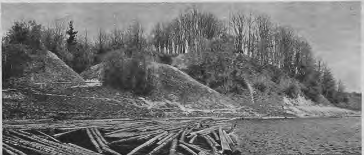
Mežotnes pilskalns, t. s. „Viesturkalns”. Skats no Lielupes puses: Redzams senās pilsētas nocielinātais stūris, pils piekājes vaļņa gals un pats pilskalns.