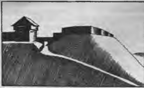
Senās Mežotnes pils uzeja un pils vārti. Ārpuses skata rekonstruktijs zīmējums. Zīm. P. Pauļuks.