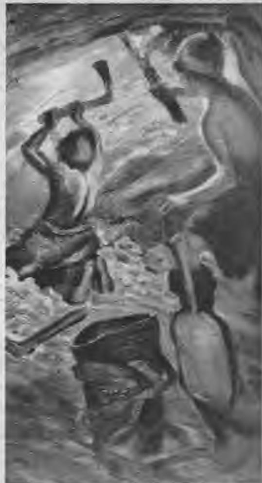
Vecās sāls raktuvēs Zalcburgas apakšzemē pirms 3000 gadiem.

Par Untersberga kalnu masīva sāls bagātībām gadu simteņiem cīnījušās daudzas tautas. Bronzas laikmetā tās izmantoja ilirieši, tad ķelti, pēc tam romieši, kamēr VI gadu simteni bavārieši beidzot nodrošināja sev. Jau iliriešu un ķeltu laikā pastāvēja plaša sāls tirdzniecība, kad sāls krājumi no šējenes plūda pa dažādiem sāls ceļiem, īpaši gan pa Donavu, gan uz ziemeļiem, gan dienvidiem. Bavāriešu hercogs Teodo I (Theodo I), augstsirdīgs valdnieks, uzdāvēdams bīskapam Zalcburgu, kas toreiz saucās Juva-vum, lika pamatu šīs pilsētas uzplaukumam. Zalcburgas bīskaps šo dāvējumu, kam pēc tam bija nākuši vēl klāt arī cīņi, līdz ar