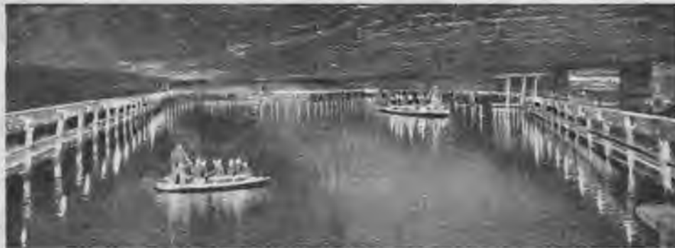
Berchtesgādenas sāls raktuvju lielais apakšzemes sāls ezers.