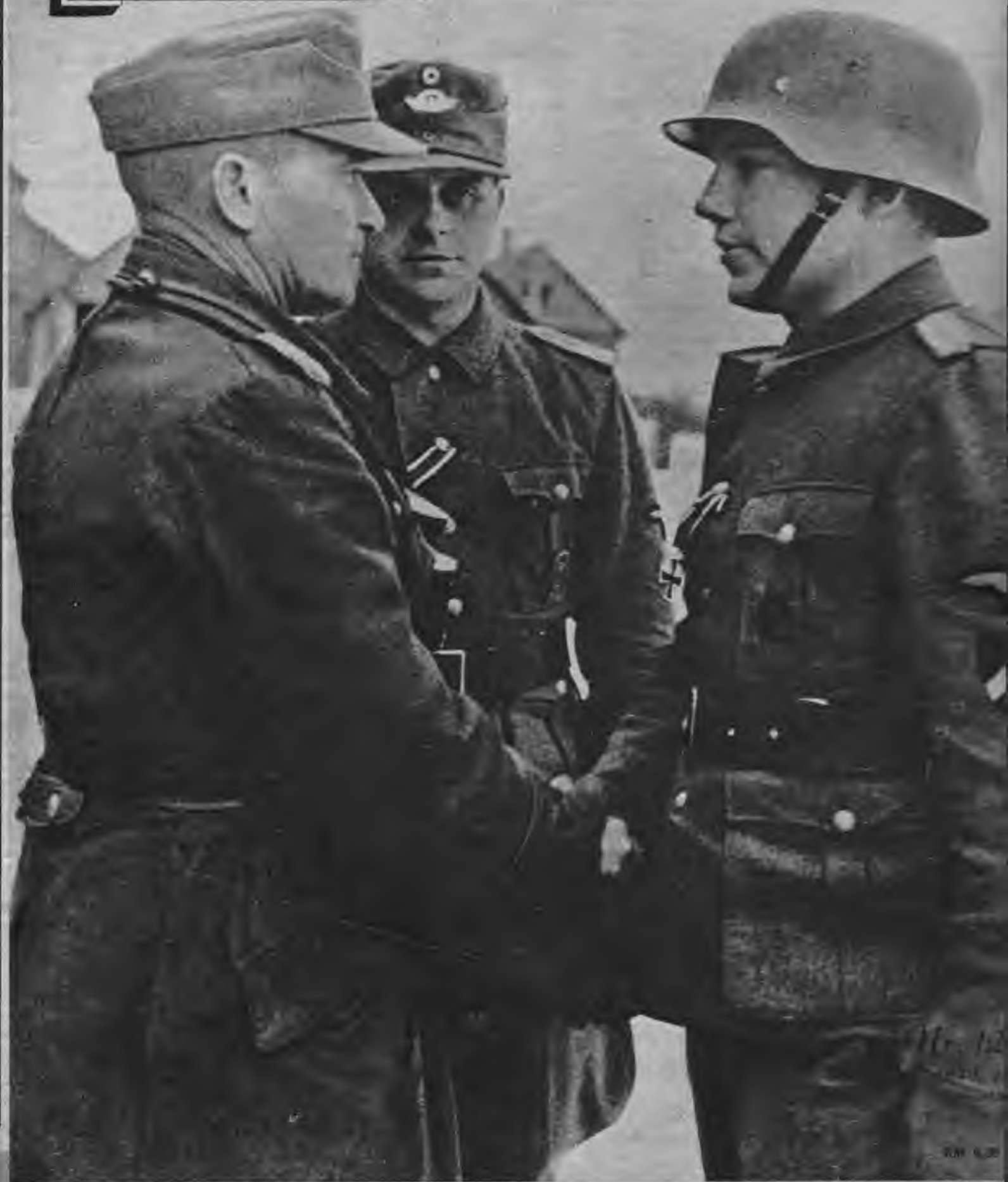
Dzelzs krusts latviešu leģionāriem