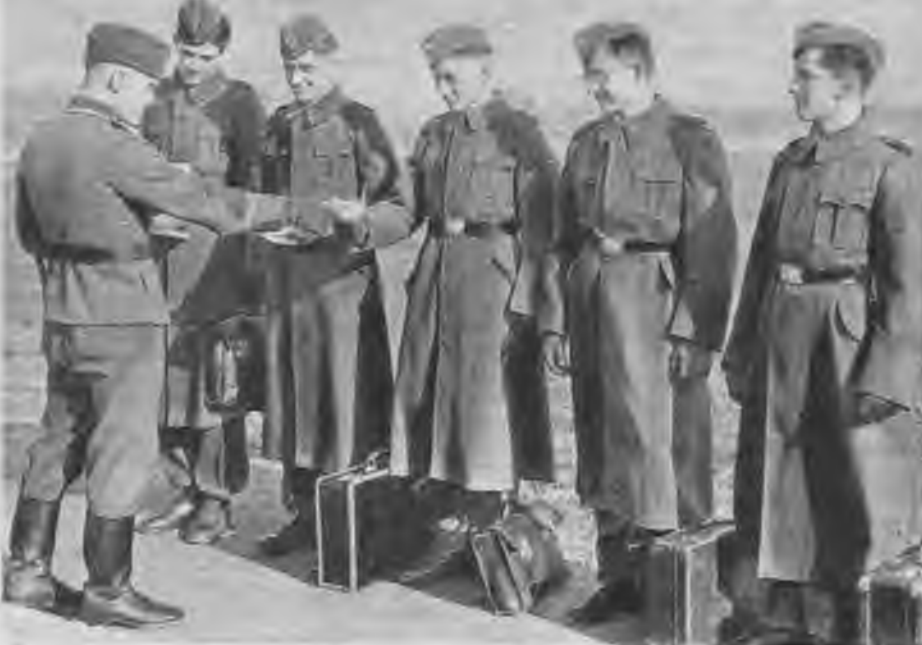
Visas zemēs sakāties sagatavošanas totālajam kaņam. Gan aktīvo cīnītāju, gan darba darītāju rindās stājušies daudzi miljoni. Franču jaunieši, kas brīvprātīgi pieteikušies vācu armijas izpalīgu dienestā, jau ietērpti jaunajās uniformās un saņem komandējuma pavēli uz jauno dienesta vietu.